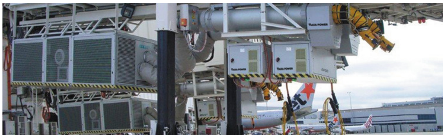
Аэродромный кондиционер PCA, аэродромный преобразователь и устройство подвода рукава, производства компании AXA Power, в аэропорту Мельбурна

Рукав заканчивается сужением, диаметром 8", позволяющим установить поворотный аэродромный переходник. Подсоединение переходника к самолету выполняется очень просто, поскольку шарнирное соединение исключает перекручивание и вращение шланга в нежелательное положение. Также, изгиб в 45°С позволяет предотвратить изгибы при подсоединении к самолету. В целом, это означает постоянный поток воздуха через шланг.